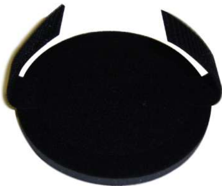
Подошва мягкая 150мм на липучке для ручного шлифования арт.: B6000020002