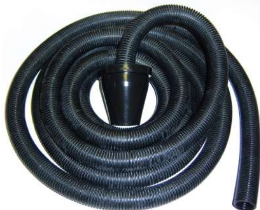
Пылеотводный шланг для шлифков, Ø21мм, 4м. арт.: LTUB0100004